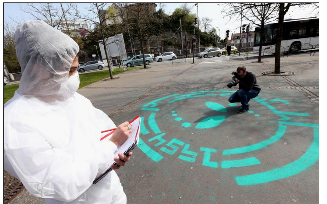
■ Le photographe Émile Frost est venu observer ces symboles soudainement apparus dans la nuit de dimanche à lundi alors qu'un expert a brièvement noté quelques mesures.