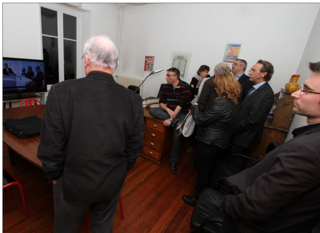
■ Pas de déballage à chaud : au PS, le linge sale se lave en famille.